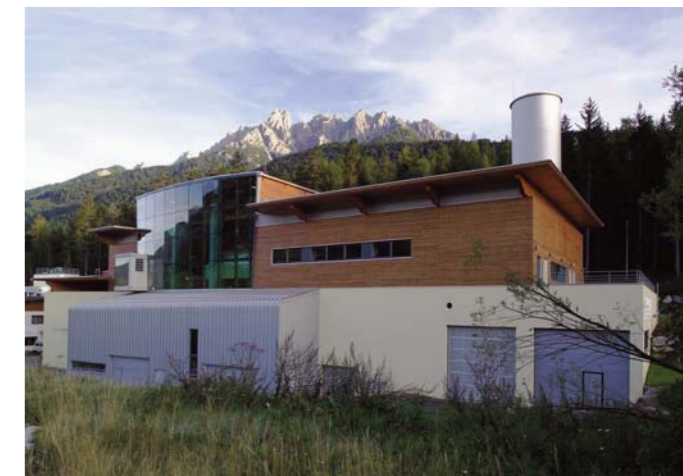
So schön können Holzheizkraftwerke sein.

Hinweis: Ausschlaggebend für die Anlageentscheidung ist ausschließlich der von der Bundesanstalt für Finanzdienstleistungsaufsicht (BaFin) gestattete Verkaufsprospekt. Für den Beitritt ist es notwendig, dass ein Investor den vollständigen Verkaufsprospekt inklusive aller Anlagen und eventuellen Ergänzungen – insbesondere den Risikohinweisen – zur Kenntnis nimmt und versteht und eventuell ergänzend den Rat eines steuerlichen und rechtlichen Beraters in Anspruch nimmt.